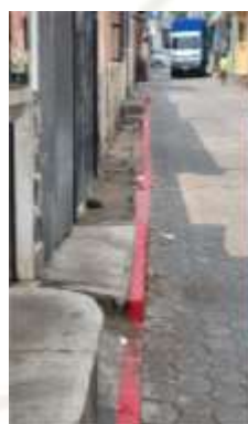
CUARTA AVENIDA DE LA ZONA CINCO. Señalización con línea roja (calle de Los Gatitos) ambos lados de la calle (en proceso).