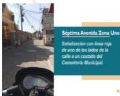
Séptima Avenida Zona Uno Señalización con línea roja de uno de los lados de la calle a un costado del Cementerio Municipal.