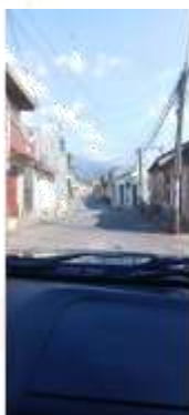
Segunda Avenida de las zonas 1 y 5. Señalización con línea roja ambos lados de la calle y señalización con línea amarilla de las zonas de carga y descarga, con tiempo máximo de 15 minutos para cada vehículo.