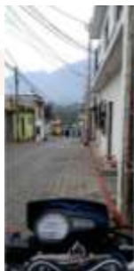
Primera calle Zona Cinco Señalización con línea roja ambos lados de la calle y señalización con línea amarilla de las zonas de carga y descarga, con tiempo máximo de 15 minutos para cada vehículo.